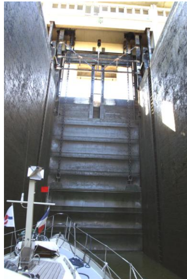
Grote deuren met een verval van 10.76 mtr.

Vandaag maar een heel kort stukje, we vertrekken om 8.30 uur, en zijn de laatste sluis op dit kanaal uit om 9.15 uur. Het verval is 10.76 meter en dan nog een halfuurtje naar Chalon.