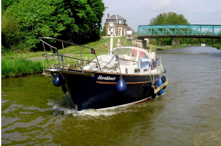
Onze, tot motorboot omgebouwde, zeilboot

Nadat we in 2007 door Frankrijk waren gevaren en het enorm mooi vonden en er echt van genoten hadden, stond ons besluit vast: dit doen we nog een keer!