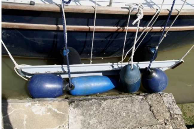
Af en toe moeilijk afmeren !