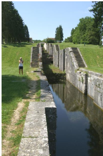
Oude sluzentrap Rogny

Weer een gratis overnachting, incl. de douche!