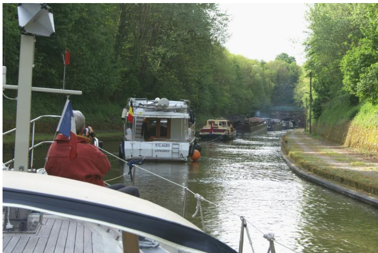
Klaar voor de tunnel.