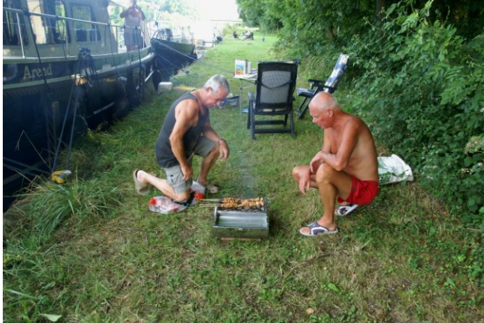
BBQ-en in Sampigny