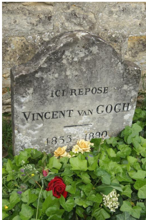
Laatste rustplaats Vincent van Gogh

Koud, heb zelfs mijn bivakmuts op. We horen dan een raar geluid, en het duurt even voor we lokaliseren waar het vandaan komt: de schroefasafdichting is water gesmeerd en daar zit nu te weinig water in, even knijpen en het is weer in orde, toch in de gaten houden. We stoppen in Auvers, een gratis steiger van de VNF, dit is de plaats waar Vincent van Gogh is overleden, we maken een van Gogh tour, het is een fraaie plaats.