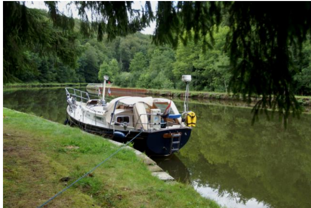
Afmeerplek bij PK 115

We liggen hier met 4 andere Nederlandse boten.