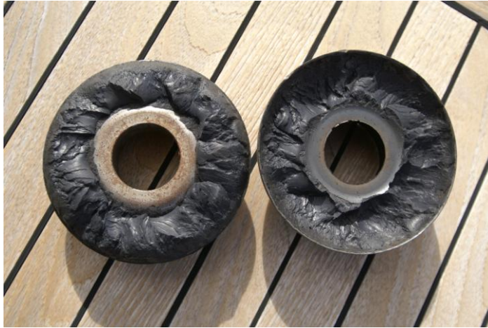
De afgescheurde flexibele koppeling

Gelukkig liggen we op een plaats waar water en elektriciteit is, waar we kunnen douchen en boodschappen kunnen doen.