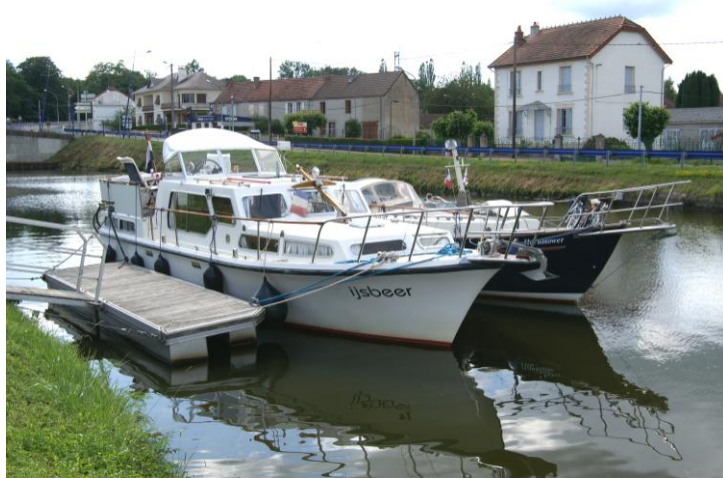
Afgemeerd naast de IJsbeer.

Vandaag varen we langer dan we normaal doen, meestal stoppen we na 4 à 5 uur varen, soms nog wel eerder, wanneer we een fraaie plek zien, we hebben immers totaal geen haast....maar er is geen plek, dus doorvaren maar....we liggen aan een steiger, naast de IJsbeer, net voor de eerste sluis van de sluzentrap naar beneden. Het uitzicht is geweldig mooi.