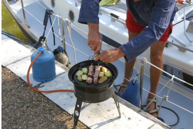
Met warm weer, skottelbraaien, een uitkomst!

In juni hebben we 7 natte dagen, 3 droge maar koud en 20 warme tot zeer warme dagen gehad.