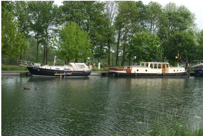
Sérancourd-Le Grand , Hornblower samen met de IJtunnel

Wim en Kees fietsen naar het VNF-kantoor om de tunnel te betalen, 2 jaar geleden deden we dit niet direct, lieten de rekening naar ons huisadres sturen om pas te betalen wanneer we thuis waren, maar de bank rekent bijna net zoveel als de passage kost, dus dat doen we niet meer...de doorgangsprijs is 21.50 euro.....en Kees vult de jerrycans met diesel. We gaan niet ver vandaag, het is bewolkt en er is veel wind, het regent, we overnachten in Sérancourd-le-Grand.