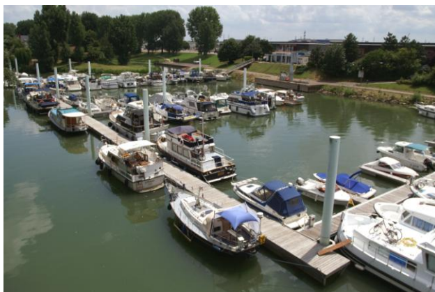
Chalon sur Saône

Jan en Astrid gaan verder naar de Middellandse Zee, dus een afscheidsetentje, we gebruiken weer de skottelbraai, zo gemakkelijk. De dieselprijs in de jachthaven van Chalon bedroeg 1,60 euro, terwijl 5 minuten verderop de diesel 0,96 kost. Wanneer je dus diesel haalt met jerrycans, scheelt dat heel veel geld. Er werd in de haven dus weinig verkocht.