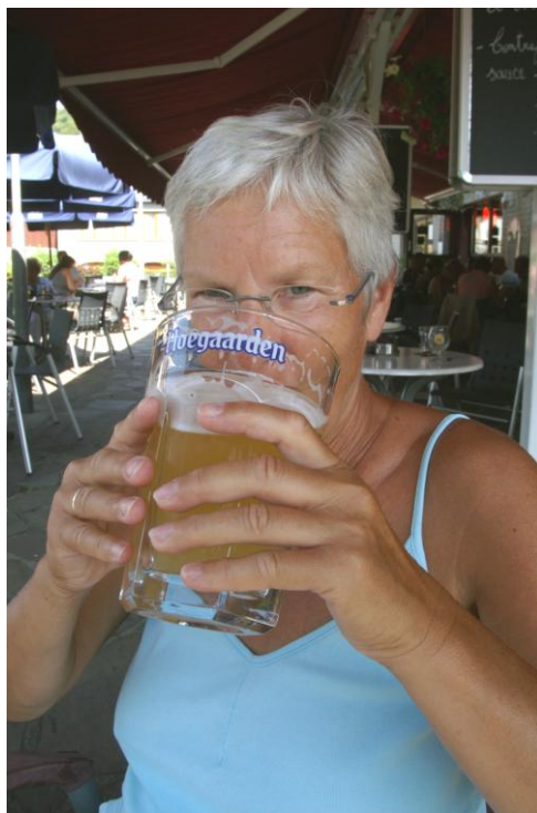
De dubbele smaakt prima.

Ze hebben daar verrukkelijk ijs en een dubbele Hoegaarden.