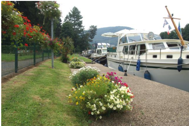
De fleurige haven van Revin.